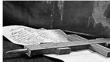
На фото Ольги Пентюговой записка об освящении храма, которую написал своей рукой священномученик Константин, пресвитер Шарковщинский. На бумаге и на кресте текст одного содержания.

Погиб священник за то, что не отрекся от веры Христовой. Незадолго до своей смерти отец Константин произнес такие слова: «Что Бог пошлет, то и буду терпеть». При земной жизни отец Константин был примером для своих прихожан, вел подвижническую и бо-