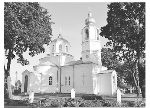
Храм Воскресения Христова в г. Дисна