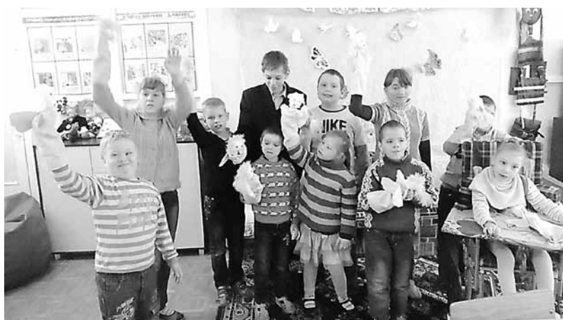
Реализация проекта «Под сенью духовности».