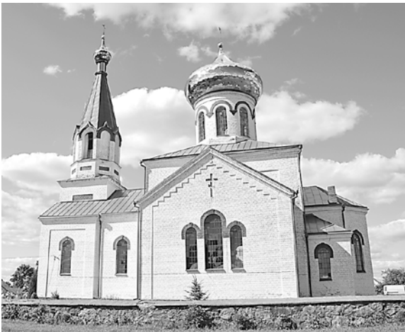
Храм великомученика Георгия Победоносца, д. Ситцы Докшицкого района