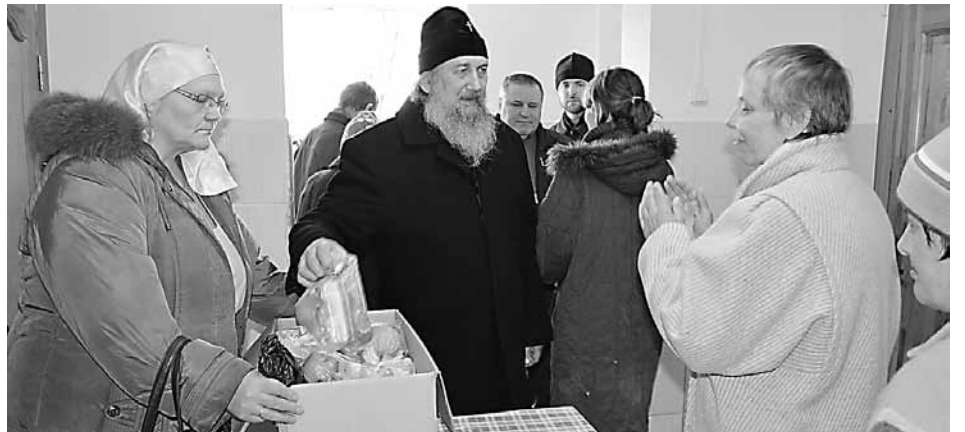
Архиепископ Полоцкий и Глубокский Феодосий в ГУОС «Полоцкий психоневрологический дом-интернат для престарелых и инвалидов».