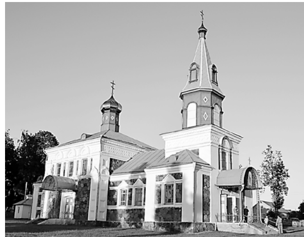
Храм Покрова Пресвятой Богородицы, г. Докшицы

ный путь для встречи со святостью и стяжания благодати? Путника влечет желание приблизиться к источнику святости, разрешить какой-либо вопрос, касающийся выбора дальнейшей жизни, совет, вразумление, укрепление в вере. Мы знаем множество примеров, когда цель паломничества заключалась в вымалывании здоровья и исцеления для себя и своих родных, возможность покаяться за тяжкие грехи и ошибки молодости. На паломничество могло подвигнуть отпадение от Церкви кого-то из близких и желание вымолить ему веру. Бывали так называемые «обетные» богомолья, когда человек в смертельной болезни или крайней опасности давал Господу обещание: если ему суждено остаться в живых,