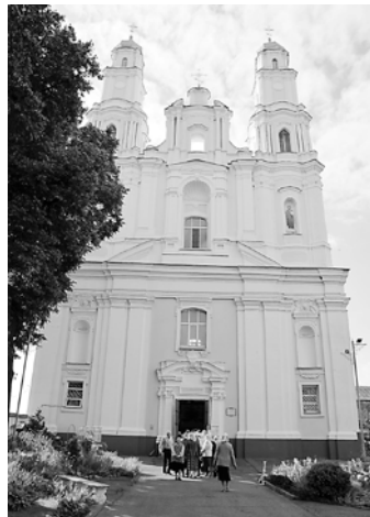
Собор Рождества Пресвятой Богородицы, г. Глубокое