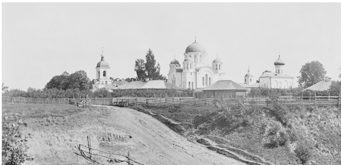
Спасо-Евфросиниевский монастырь. Фото 1911-1912 гг.