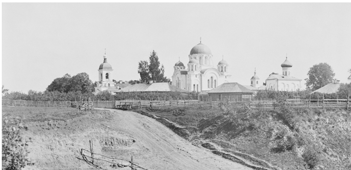
Спасо-евфросимиевский монастырь. Фото 1911-1912 гг.