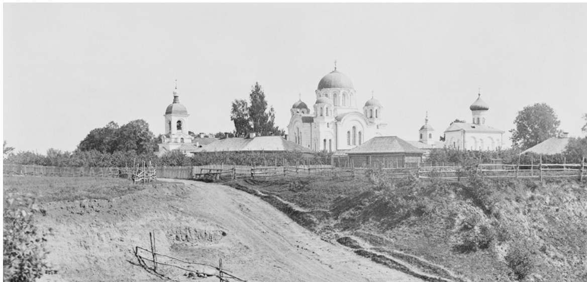
Спасо-евфросимиевский монастырь. Фото 1911-1912 гг.