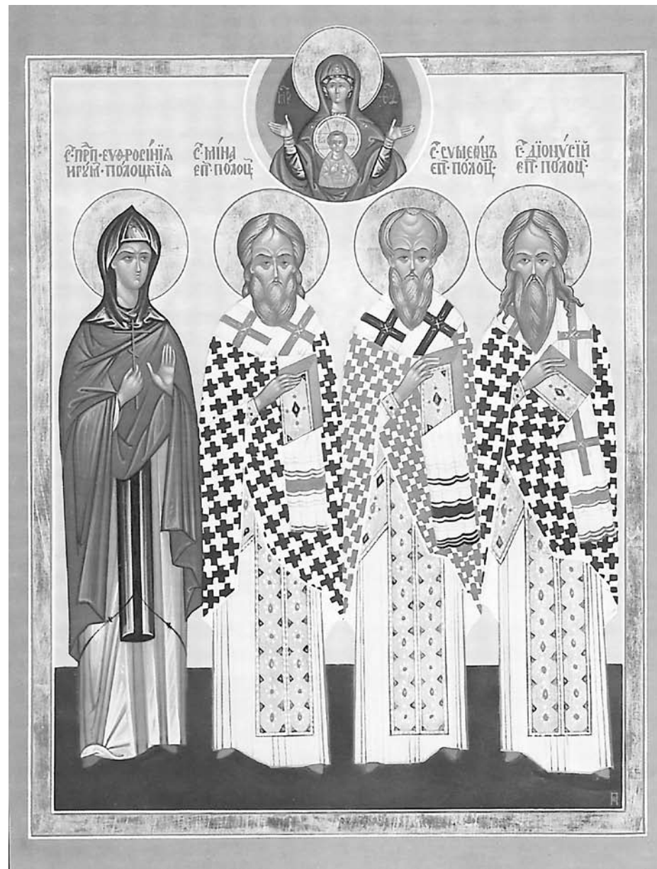
Святые угодники Полоцкой земли, 2010 год.

Выписка из фотоальбома «Храмы и монастыри Полоцкой епархии».