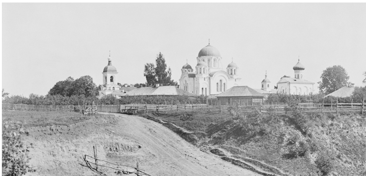
Спасо-евфросимиевский монастырь. Фото 1911-1912 гг.