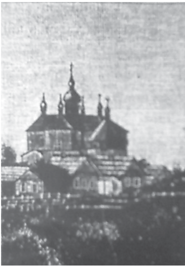
Храм Воскресения Христова в XIII веке

Церковь Воскресения Христова не закрывалась, была действующей