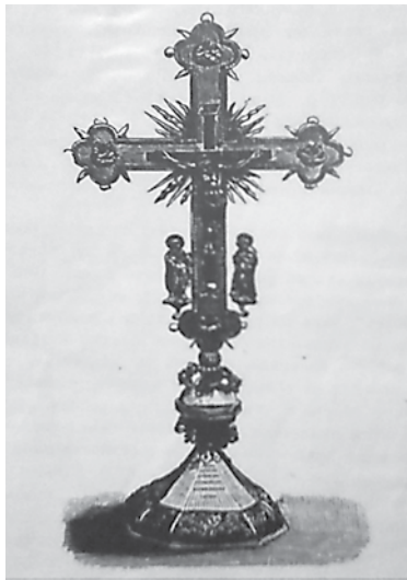
Серебряный крест (символ православного братства)